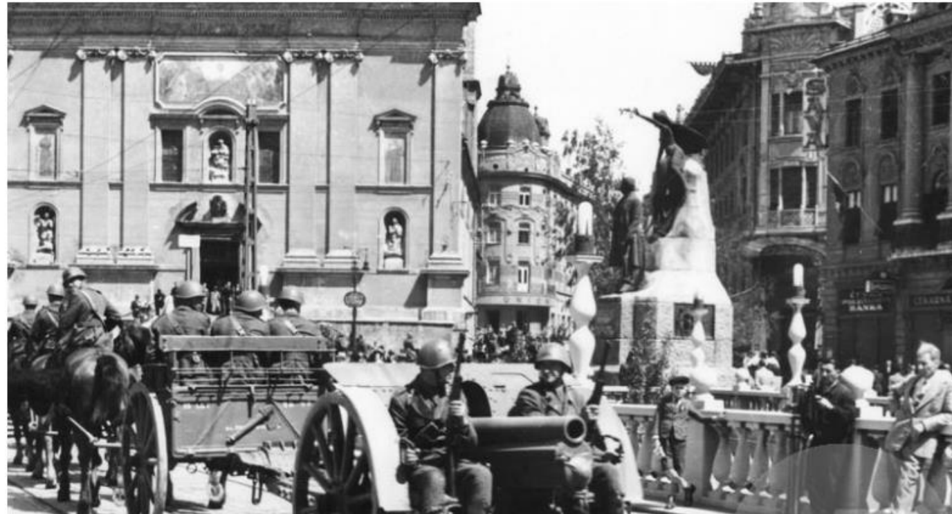
Parada italijanske vojske v Ljubljani leta 1941