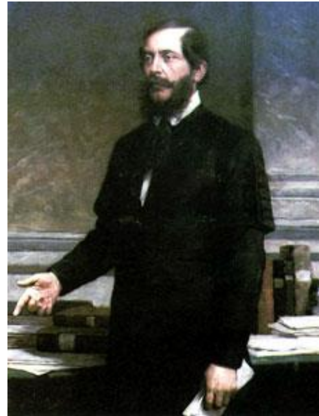
voditelj madžarske vlade