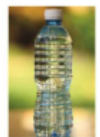
Plastenka iz PETE-ja

Tokrat mi ni potrebno pošiljati fotografije miselnega vzorca. Prinesel ga boš v šolo.