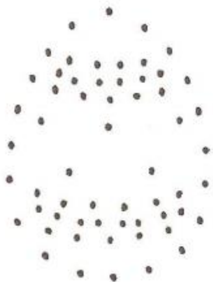
VZOREC ZA LUKNJICE