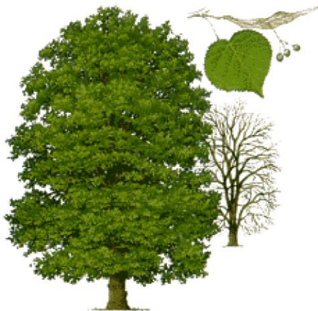
Slika 2: Lipa ( https://cutt.ly/XtYztAm )

Če ti slike ne prilepi v PPT, jo skopiraj v Wordov dokument in jo od tam kopiraj v PPT.