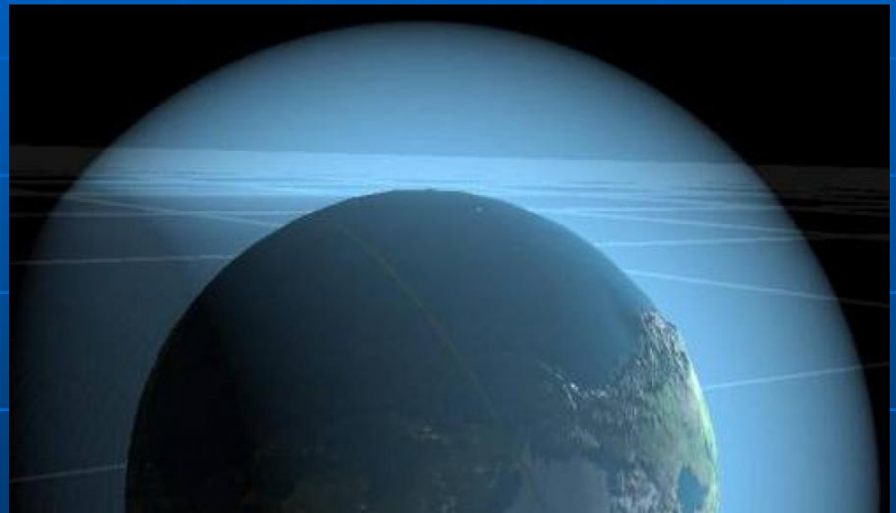
Slika 2: Zemljina atmosfera ( https://cutt.ly/QtOPHx8 )

Preden sončna svetloba doseže Zemljo, mora skozi več kot 10 km debelo plast zraka, ki obdaja Zemljo.