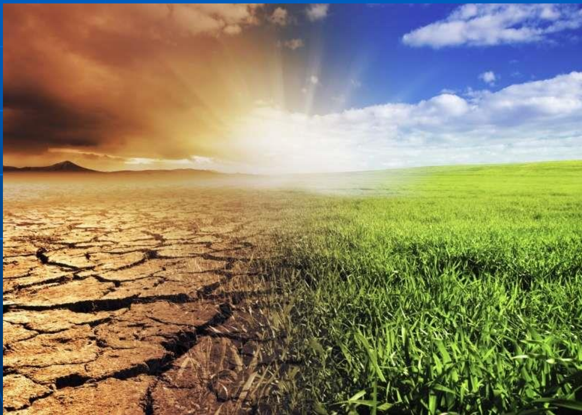
Slika 4: Segrevanje tal ( https://cutt.ly/PtOFnwg )

Zemeljsko površje svetlobo vpije , zato se tla segrejejo .