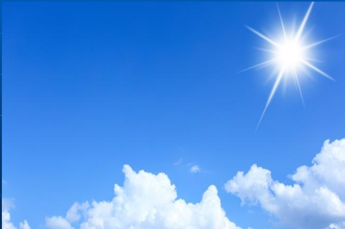
Slika 3: Zrak ( https://cutt.ly/8tOALu5 )

Zrak je PREPUSTEN in PROZOREN. Zato sončno svetlobo prepušča, svetloba pa zraka NE SEGREVA. Svetloba nemoteno doseže tla.