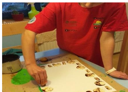
OKVIR – VZOREC IZ LIKOV