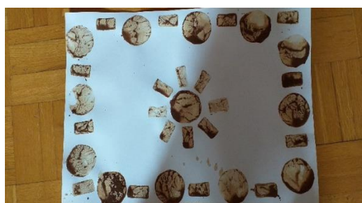
OKVIR IN SONCE

ZA TISKANJE S TEMPERA BARVAMI SI NAREDI VEČ ŠTAMPILJK. PAZI, DA SE NE BODO ZAMEŠALE ... ČE BI LIK Z BARVO DAL V DRUGO BARVO, BI SE BARVE UMAZALE.