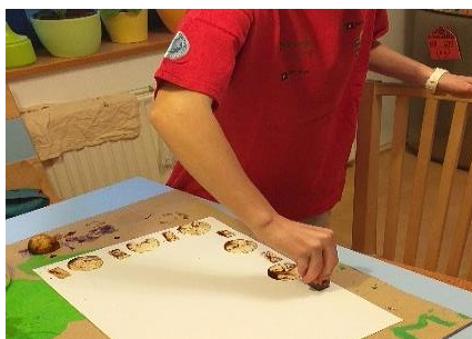
TISKANJE S KAVO

– NA ROB LISTA NATISKAJ OKVIR TAKO, DA BO NASTAL VZOREC (LIKI NAJ SE VES ČAS PONAFLJAJO). V SREDINO NATISKAJ FIGURO.