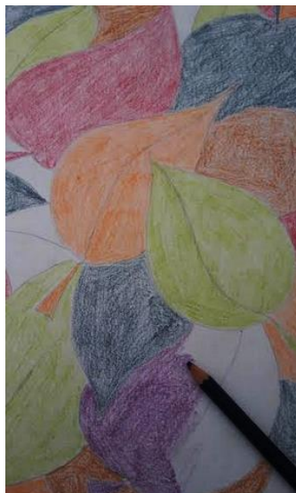
Slika 2: Barvanje ploskev