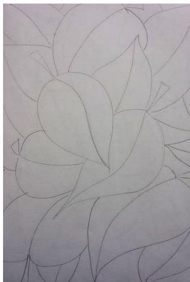
Slika 1: Oblikovanje skice