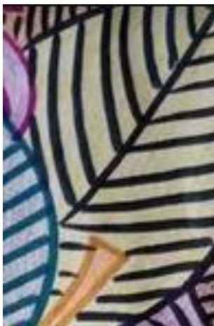
Slika 4: Uporaba ene barve flomastra