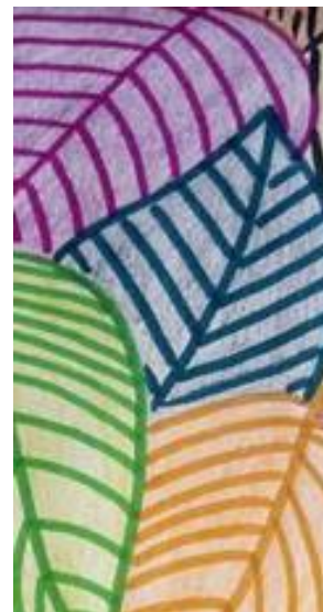
Slika 3: Ujemanje barve flomastra z barvno ploskvijo