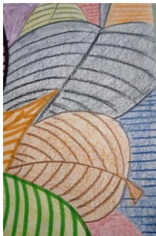
Slika 5: Obris z barvicami