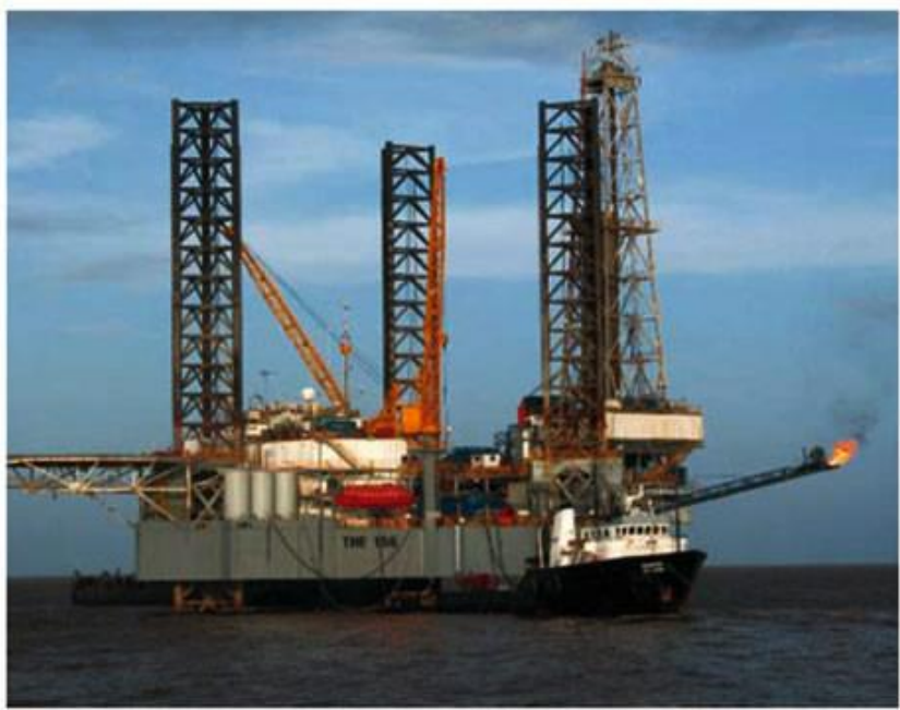
Drilling and Well-testing in Venezuela Offshore