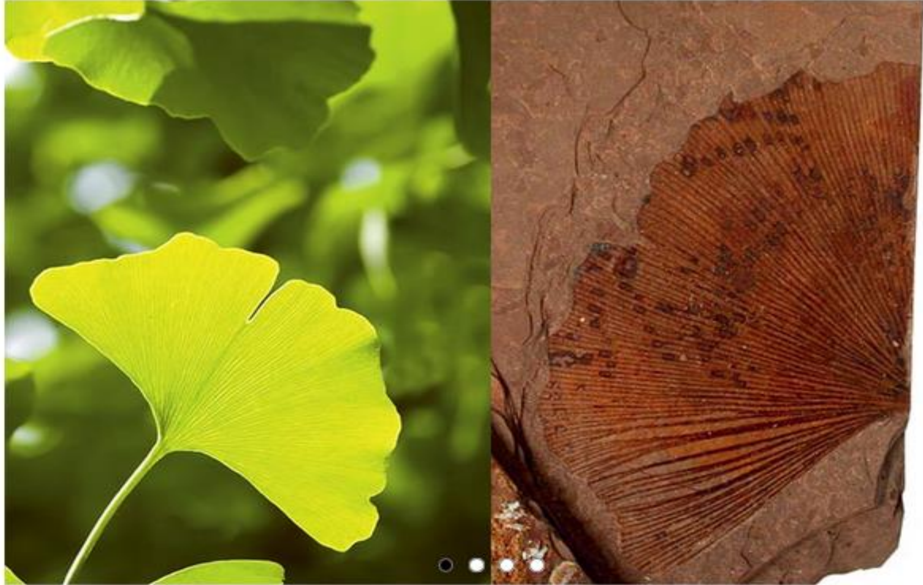
Fosilni odtis lista dvokrpega glnka In danes živeči predstavnik Najbolj znan rastlinski živi fosil je dvokrpi ginko. Ima za golosemenke nenavadne pahljačaste liste, katerih oblika se ni spremenila že okrog 200 milijonov let. V naravi raste na Kitajskem, drugod ga gojijo v parkih.