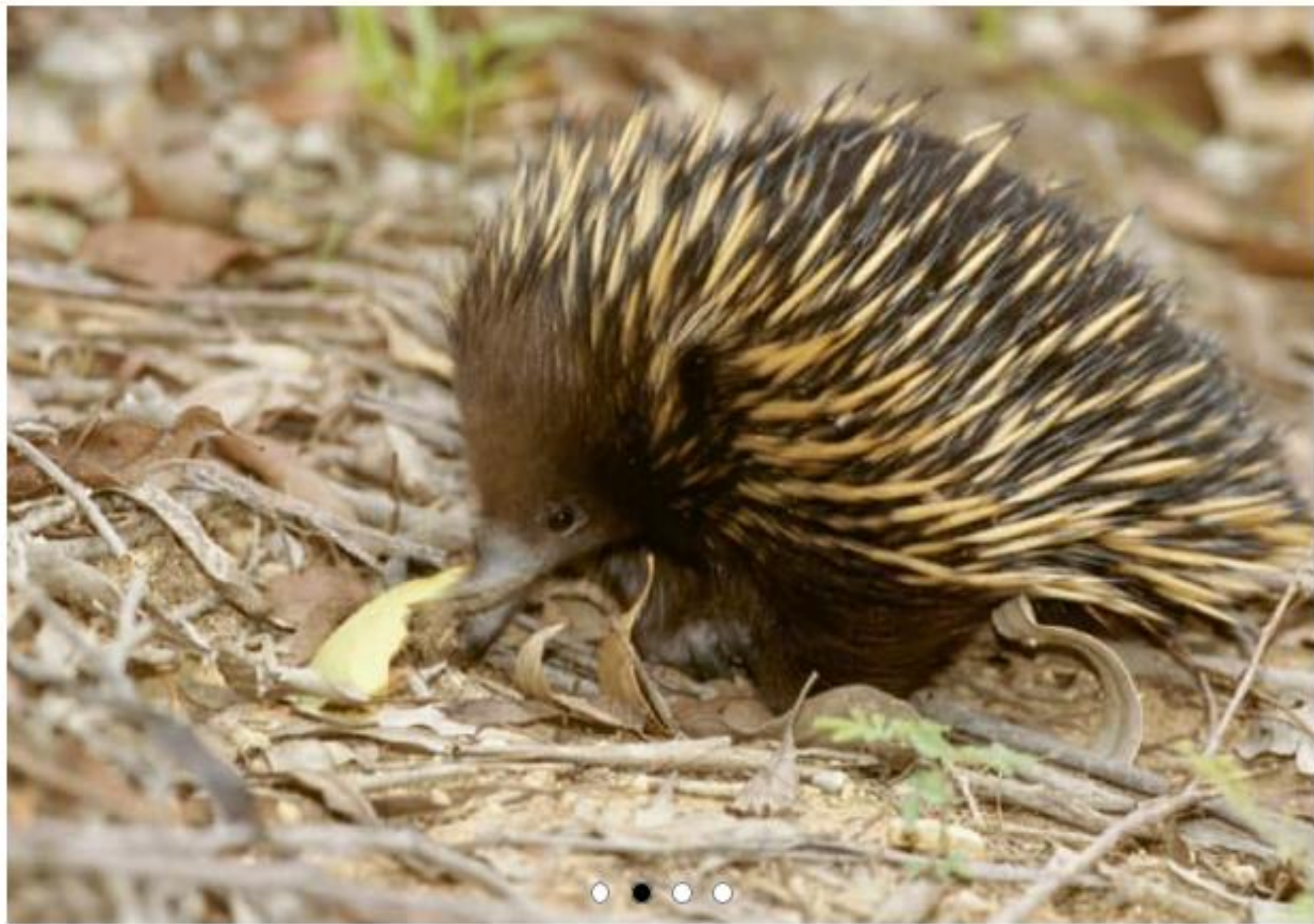
Kijunati Ježek Značilni avstralski endemit