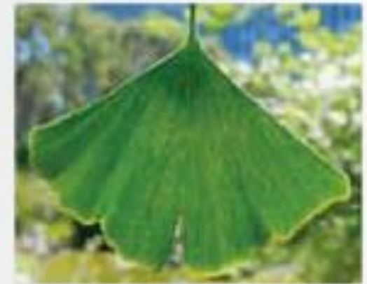
dvokrpi ginko (golosemenka)