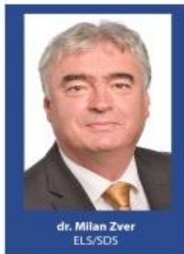
dr. Milan Zver ELPS/SDS