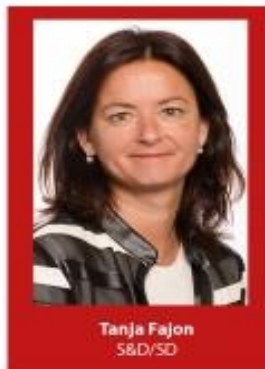
Tanja Fajon S&D/SD