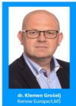
dr. Klemen Grošelj Renew Europe/LMS