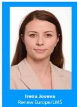
Irena Joveva Renew Europe/LMS