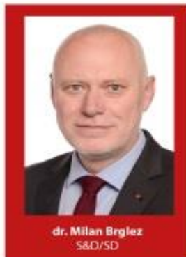
dr. Milan Brglez S&D/SD