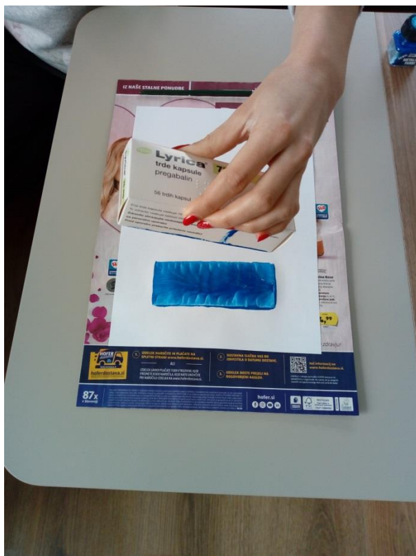
4. Embalažo previdno dvignemo.