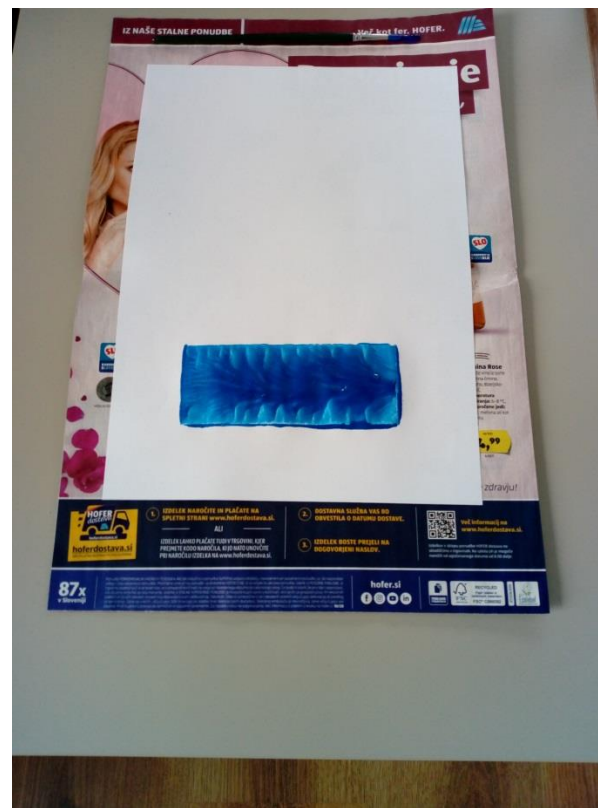
5. Na listu je nastal ODTIS. Odtis ploskve kvadra imenujemo PRAVOKOTNIK .